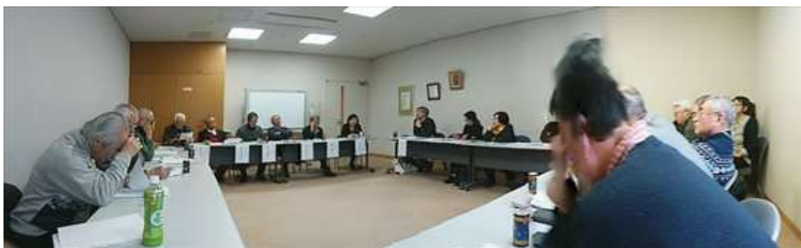
スマホでパノラマ撮影したら一部欠落してました（すみません）スタッフ込27名参加

とびっくり楽しいひと時も、あっという間に過ぎてしまいました。重ねてまたの機会を！！